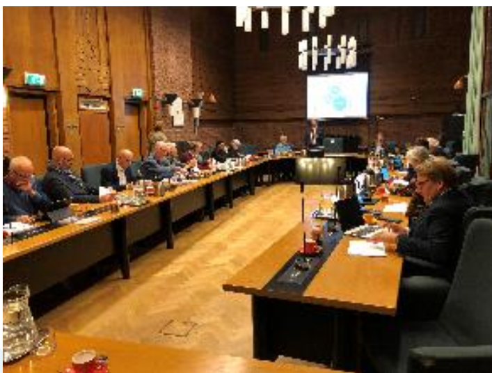
Workshop in Voorschoten over financiële indicatoren

De deelname was wisselend, maar de waardering was groot.